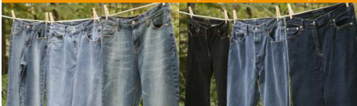
Dylon Wash & Dye navy blue - teksaseid enne ja peale värvimist.

Kaitse käed kummikinnastega ja tühjenda koti sisu pesumasinasse. Seejärel pane sinna ka riie mida tahad värvida. Pese 40 kraadi C puuvillapesu programm ilma eelpesuta. Kui programm on valmis, pese riie veelkord 40 kraadi pesuprogrammiga, lisades pesuvahendit. Sellega puhastad nii riide kui masina ülejäänud värvist. Seejärel kuivata riid, eemal soojuskehast ja ka mitte päikese käes.